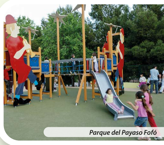
Parque del Payaso Fofó