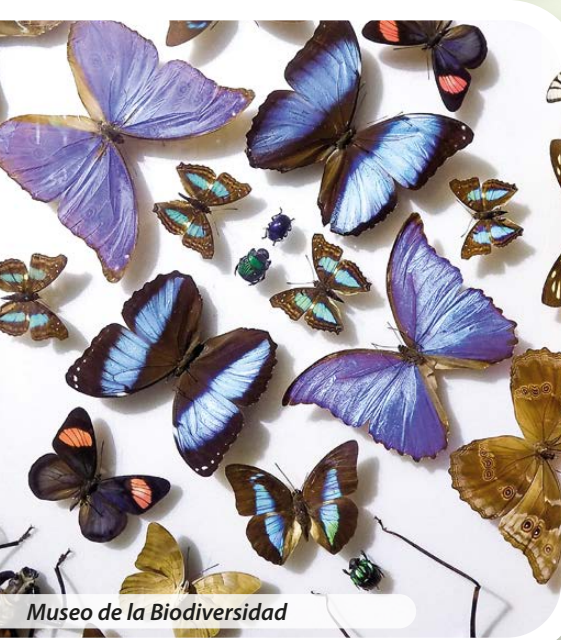
Museo de la Biodiversidad