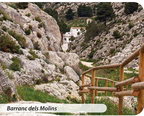
Barranc dels Molins