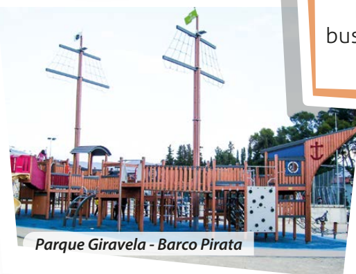
Parque Giravela - Barco Pirata