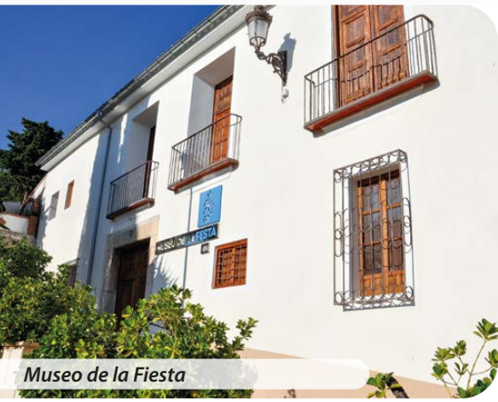
Museo de la Fiesta