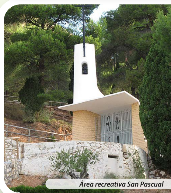
Área recreativa San Pascual