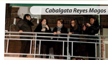
Cabalgata Reyes Magos