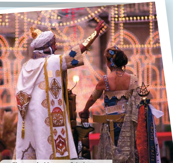
Fiestas de Moros y Cristianos

Septiembre es un mes singular porque tiene sus fiestas patronales en honor a la Virgen de los Desamparados . Son los Moros y Cristianos y aportan al pueblo alegría, colorido y diversión. Aún así, si no es posible venir en este mes, existe un Museo de la Fiesta que representa con trajes, armas, fotografías y demás elementos, el sentimiento de un pueblo hacia sus fiestas mayores.