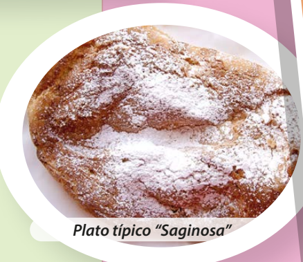
Plato típico "Saginosa"

Para comer, aprovecho para degustar la exquisita gastronomía de nuestro pueblo, aunque los dulces son mis favoritos y por eso para merendar siempre tomo Saginosa , o si es Semana Santa, las Mones de Pasqua .