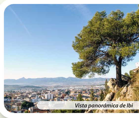
Vista panorámica de Ibi