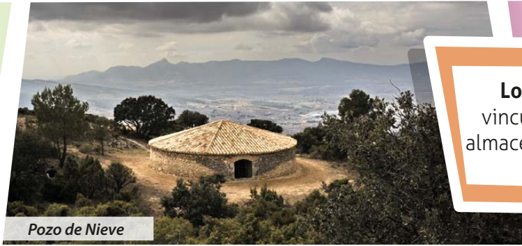
Pozo de Nieve

Los pozos de nieve , en plena montaña, están vinculados a la tradición heladera y era donde se almacenaba el hielo en invierno para después poder crear los helados artesanales ibenses.