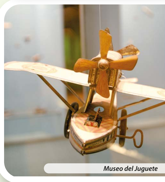
Museo del Juguete