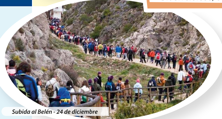
Subida al Belén - 24 de diciembre

Septiembre es un mes singular porque tiene sus fiestas patronales en honor a la Virgen de los Desamparados . Son los Moros y Cristianos y aportan al pueblo alegría, colorido y diversión. Aún así, si no es posible venir en este mes, existe un Museo de la Fiesta que representa con trajes, armas, fotografías y demás elementos, el sentimiento de un pueblo hacia sus fiestas mayores.