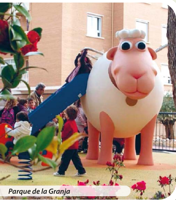
Parque de la Granja