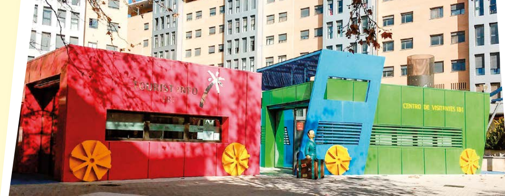
Oficina de Turismo - Tourist info Ibi